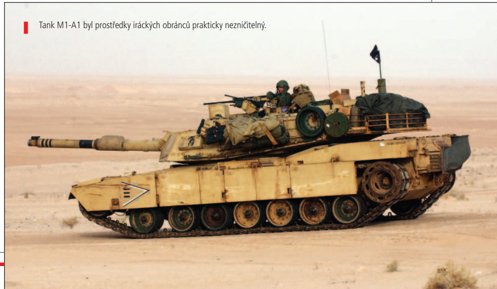
Tank M1-A1 byl prostředky iráckých obránců prakticky nezničitelný.

Rozpad centrální moci byl takřka okamžitý. Al Kut a An Nasiriyah si nárokovaly pozici hlavního města a navzájem si vyhlásily válku. Husajnovi rodiště Tikrit bylo obsazeno mariňáčkou Task Force Tripoli prakticky bez odporu poslední gardové divize Adnan, která mezitím hlasovala nohama v neprospěch diktátora. Následovaly ještě zhruba dvoutýdenní boje, které však měly převážně charakter vyčišťovacích operací. První dějství konfliktu bylo u konce. Koalice v něm ztratila 715 zabitých, 4 bojové letouny (pouze jeden prokazatelně v důsledku irácké palby) a 7 vrtulníků. Irácké ztráty jsou odhadovány na 30 000 padlých.