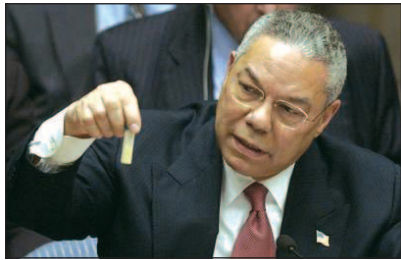
Ministr obrany Powell předvádí Radě bezpečnosti OSN ampulku s antraxem. 5. únor 2003

čila klíčové protivzdušné baterie a uzly opto-elektronické komunikační sítě ve 3. sektoru irácké PVO.