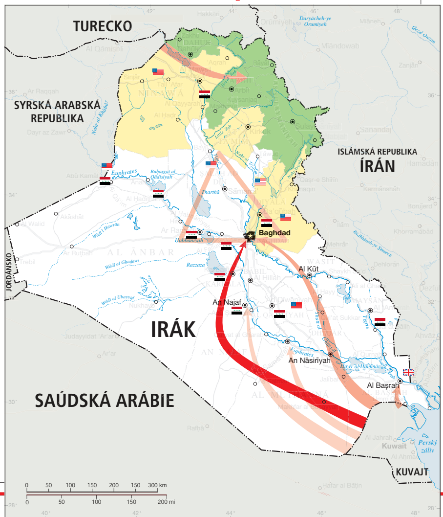
Mapa operace Irácká svoboda

Město An Nasiriyah jakožto důležité komunikační uzel padlo společným útokem námořních pěšáků a zvláštních jednotek