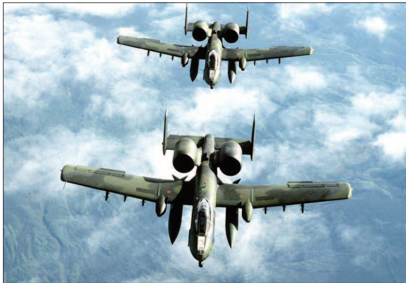
Letouny blízké podpory ničily iráckou techniku ještě za frontou.

V doporučené literatuře pro důstojníky se teprve s několikaletým odstupem objevila klasická díla T. E. Lawrence a novější analýzy činnosti vojenského poradce v cizí kultuře.